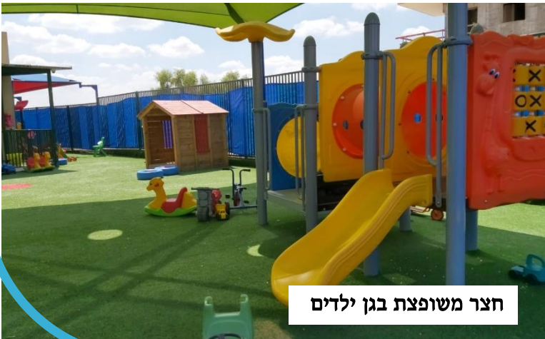
חצר משופצת בגן ילדים