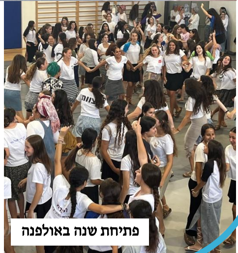
פתיחת שנה באולפנה