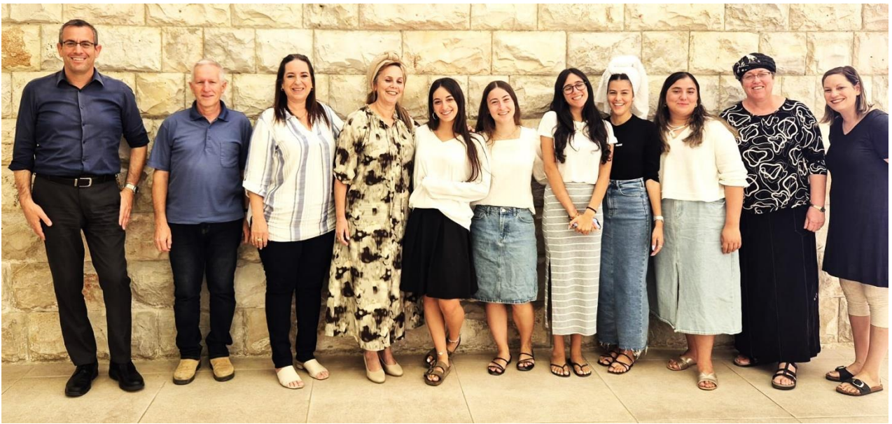
מפגש בנות שירות