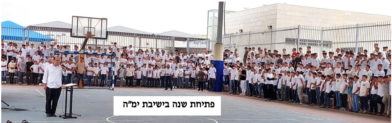
פתיחת שנה בישיבת ימ"ה