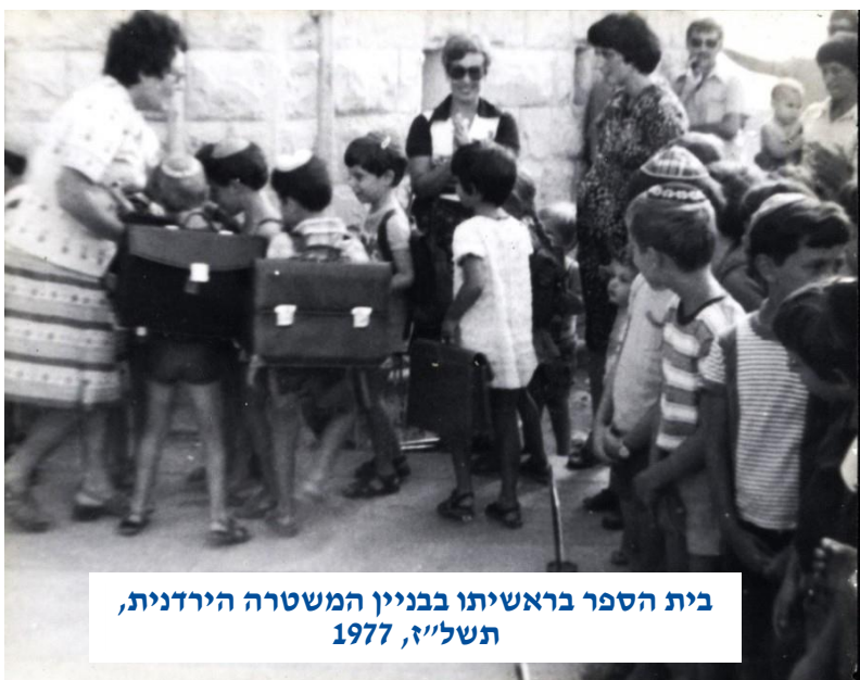
בית הספר בראשיתו בבניין המשטרה הירדנית, תשל"ז, 1977