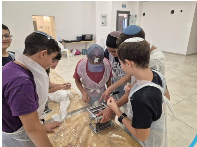
פעולות הנוער בשבוע האחרון