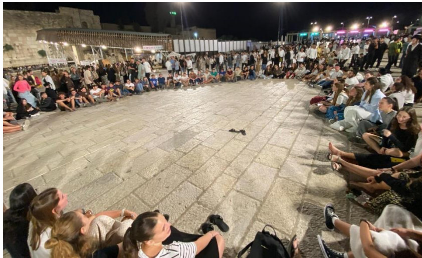
נוער אלקנה בתשעה באב בכותל