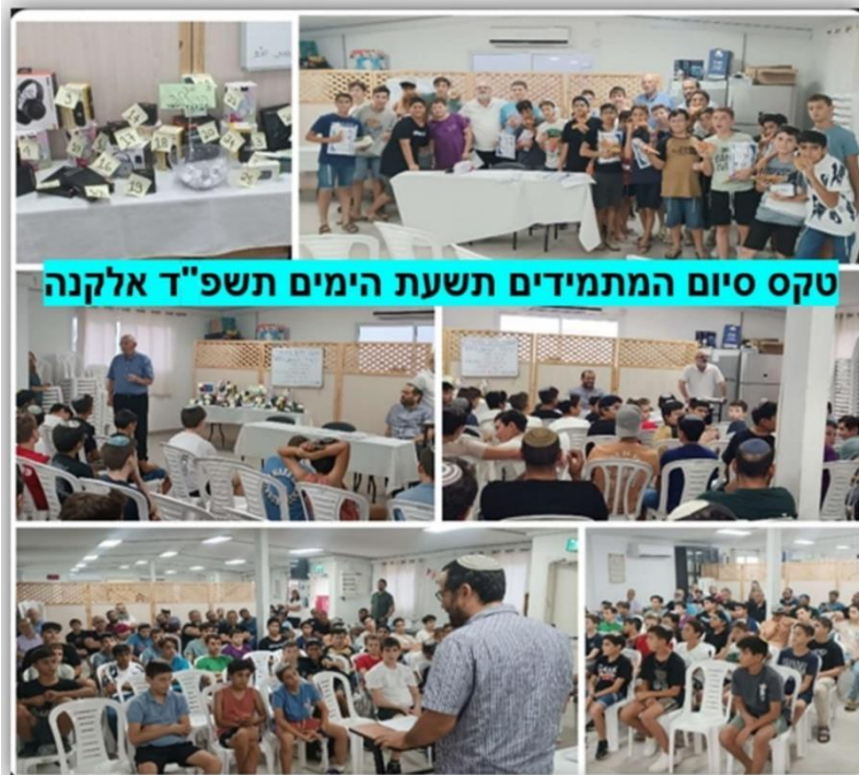
טקס סיום המתמידים תשעת הימים תשפ"ד אלקנה