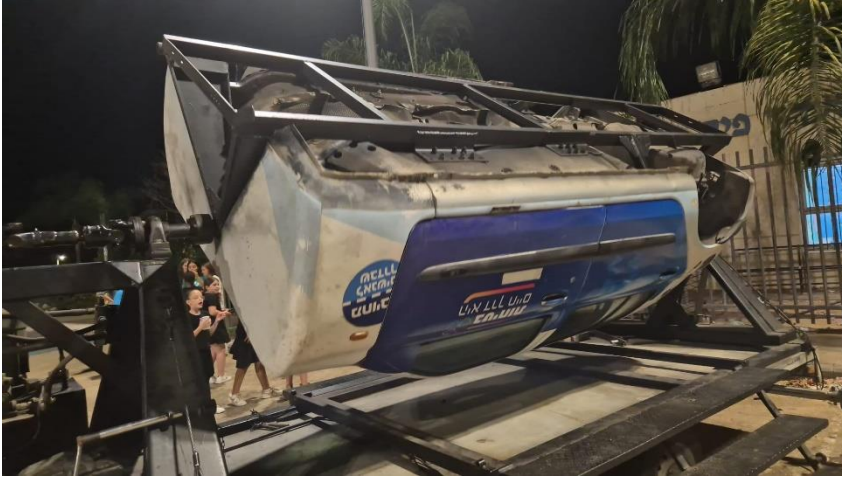
ערב זהירות בדרכים