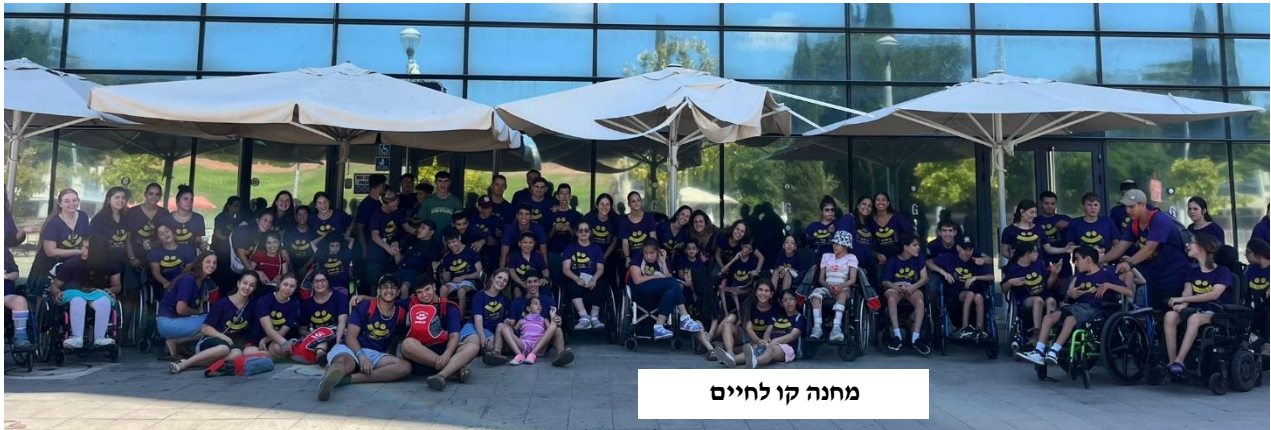
מחנה קו לחיים