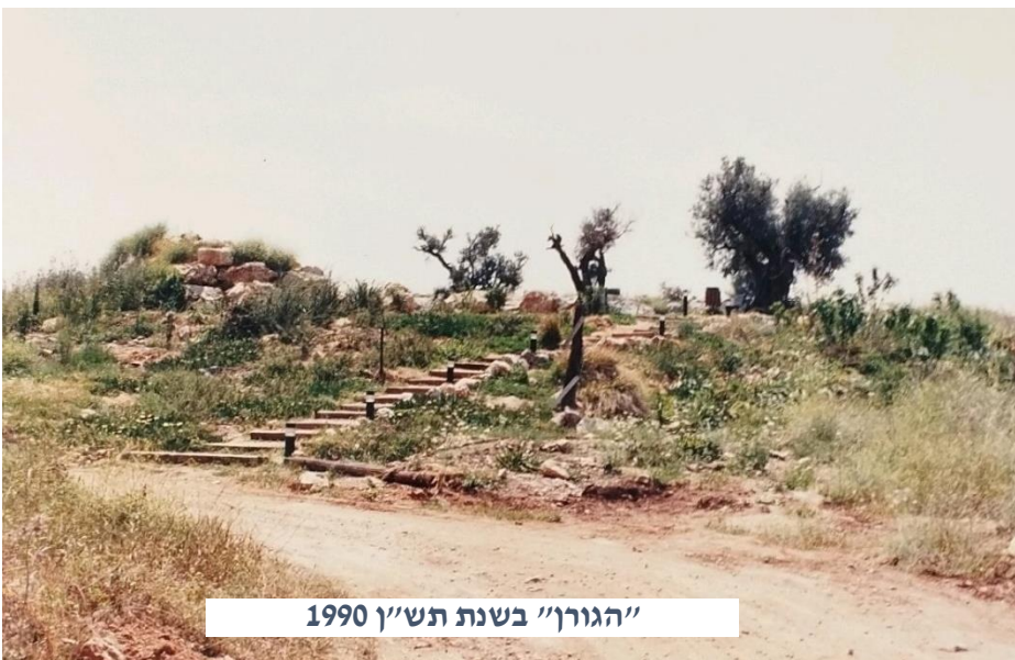
"הגרן" בשנת תש"ן 1990

הגורן המוזכר במגילה הוא מתקן חקלאי, שטח עגול ורחב ידיים ששימש לדיש: הפרדת המוץ מהדגן. "הגורן" באלקנה נקרא כך על ידי מייסדי היישוב, בשל צורתו העגולה שהזכירה להם את המתקן החקלאי. לאמיתו של דבר מדובר בצורת נוף קארסטית בשם "דולינה" (דולינה נוספת נמצאת בצמוד לשערי תקווה). בשנות החמישים של המאה העשרים, כאשר הירדנים שלטו בשומרון, הם הפכו את "הגורן" והגבעה הצמודה אליו למשלט צבאי הכולל תעלות-קשר, עמדת מרגמה מכוונת ליישובי השפלה ועמדת מקלע לשמירה על הגבעה.