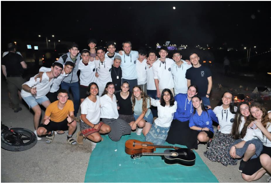
חוגגים ל"ג בעומר