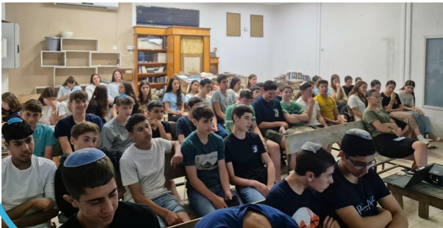
ערב חשיפה לשבט רעים

השבוע נפגשנו עם נציגי השבטים השונים, וביחד חשבנו על רעיונות לפעילויות שונות שיהיו הקייץ! תודה לכל המתנדבים שהגיעו ובזכותם יהיה לנו קייץ עמוס! בקרוב מאוד נשלח לכם את תוכנית הקייץ המלאה. שבת שלום, יחידת הנוער.